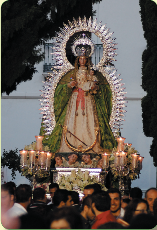
Traslado a la Iglesia Parroquial. 26 de julio.