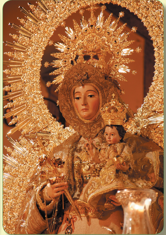
Tradicional Rosario de Doce. 16 de agosto.