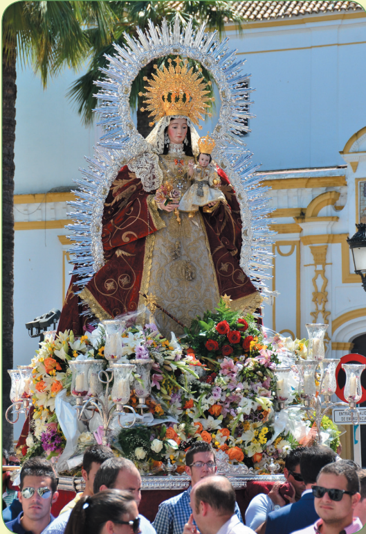
Traslado a la Iglesia del Valle. 31 de agosto.