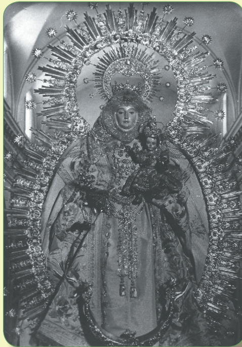
Estreno del Manto de Tisú. 15VIII/1965.

3º. Celebrar una Exposición donde el centro de la misma sea el Manto de Tisú, y todo cuanto rodeó su gestión y confección. Dicha exposición se celebrará los días del 9 al 18 de Octubre, y la misma será inaugurada con una Conferencia.